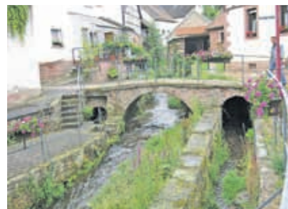
3. Platz: Laudenbach. Hochwertige Wohngemeinde heißt das Dorfleitbild. Viele Quellen, Wasserläufe und idyllische Plätze prägen den Ort.

Wie ist das Erscheinungsbild des Dorfes, wie steht es um die örtliche Wirtschaftskraft, welche sozialen und kulturellen Aktivitäten gibt es? Um diese Fragen ging es beim diesjährigen Landkreiswettbewerb „Unser Dorf hat Zukunft – Unser Dorf soll schöner werden“.