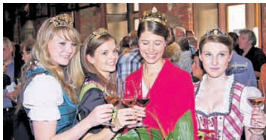
Bei der Churfranken-Weinprobe präsentieren die Weinmajestäten Müller-Thurgau Weine aus Churfranken.

Informationen: Internet: www.churfranken.de , Tel.: 09371/6606975, Fax: 09371/6606979, E-Mail: info@churfranken.de