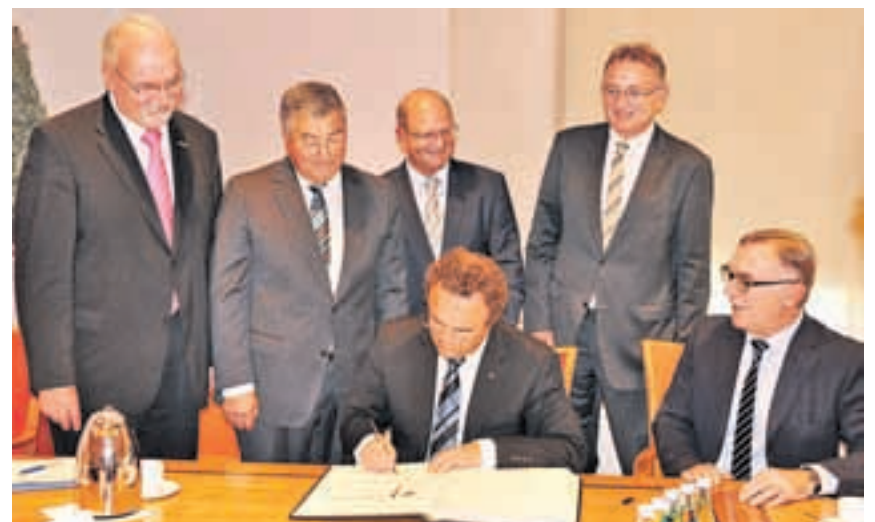
Eintrag in das Goldene Buch mit Bundesinnenminister Friedrich im ICO.