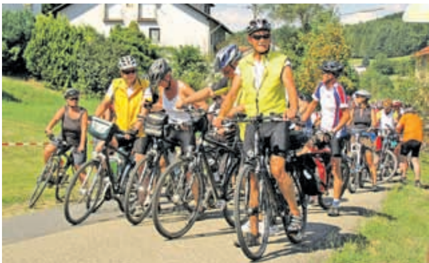
225 Kilometer und 2466 Höhenmeter legten die Teilnehmer der Radtour zurück.

Prämiert wurden am Abend der jüngste Teilnehmer mit zwölf Jahren, der älteste Teilnehmer mit 79 Jahren sowie die älteste Teilnehmerin mit 69 Jahren. Die weiteste Anreise lag bei rund 120 Kilometern, das älteste Fahrrad hatte über 22 Jahre auf dem "Buckel".