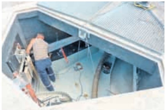
Das gesamte Sickerwasserleitungssystem ist nun sicher mit HDPE ausgekleidet.

Diese Arbeiten hat nun die Firma Trolining (Troisdorf) von April bis Anfang September 2013 unter Bauaufsicht des Büros IBU (Tauberbischofsheim) ausgeführt. Alle Sickerwasserschächte wurden bis zu einer vorgegebenen Wasserstandslinie mit HDPE-Platten ausgekleidet. Die Platten wurden verdübelt und mit einem Spezialmörtel hinterfüllt. Die Stöße der Platten wurden verschweißt. Ebenso verschweißt wurden die Anschlüsse an die bestehenden HDPE-Leitungen.