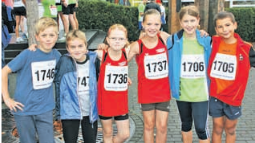
Stolze Finisher des Schüler/innen-Laufes.