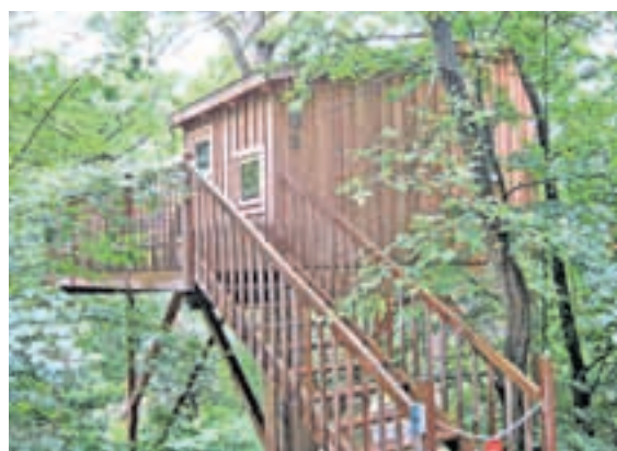
1. Platz: Mönchberg. Übernachten in einem Baumhotel. Eine Attraktion der besonderen Art, die nur der schmucke Luftkurort im Spessart bietet.