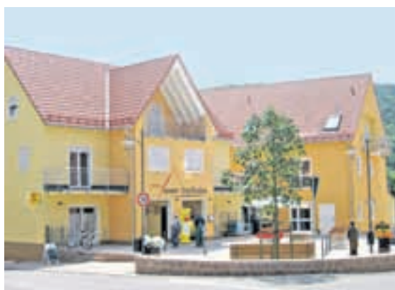
2. Platz: Rück-Schippach. Ein Alleinstellungsmerkmal genießt der Ort mit dem neuen Dorfladen. Er ist optischer Mittelpunkt und Begegnungsort für Jung und Alt.