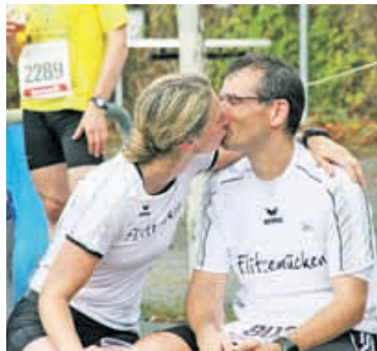
Glückliche Lauftegethernehmer am Ziel.

Mehr Infos, Ergebnisse und Bilder unter: www.Laufftag.de