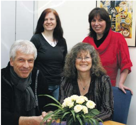
Das Team der Schwangerenberatung im Landratsamt Miltenberg.

Mehr als 750 Frauen, Männer und Paare haben sich im vergangenen Jahr mit den unterschiedlichsten Anliegen an die Beraterinnen gewandt. Bei 84 Frauen/Partnern wogen die Probleme so schwer, dass die KlientInnen über einen Schwangerschaftsabbruch nachdachten.