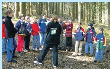
„Energiemeditation für Jungen“

Ein umfangreiches Angebot gibt es auch wieder in diesem Jahr: Neben den Mitgliedern des AK „Mädchenarbeit“ bieten der