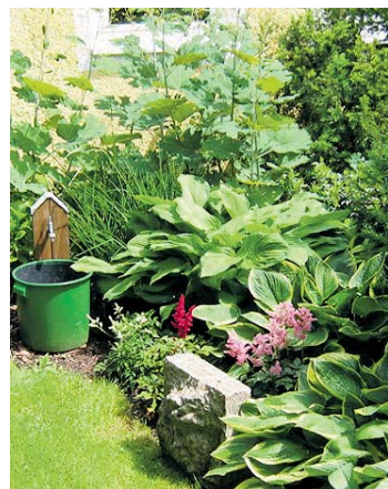
Nur Zentimeter groß oder bis zu einem Meter mächtig - Hosta ist vielseitig.

Wie ein ruhender Pol erheben sich Hosta aus niedrigem Blattgewirr, gliedern Gartenräume und bringen Farbe in schattiges Grün. Auch wenn bei dieser so genannten Blattschmuckpflanze die Blätter im Vordergrund stehen, ganz vergessen sollte man ihre attraktive Blüte dennoch nicht. Auf hohen Stängeln recken sich Trauben aus weißen, lavendelfarbenen, blass- oder dunkelvioioletten Blütenglocken.