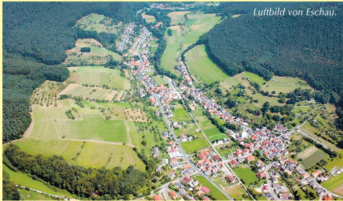
Luftbild von Eschau.