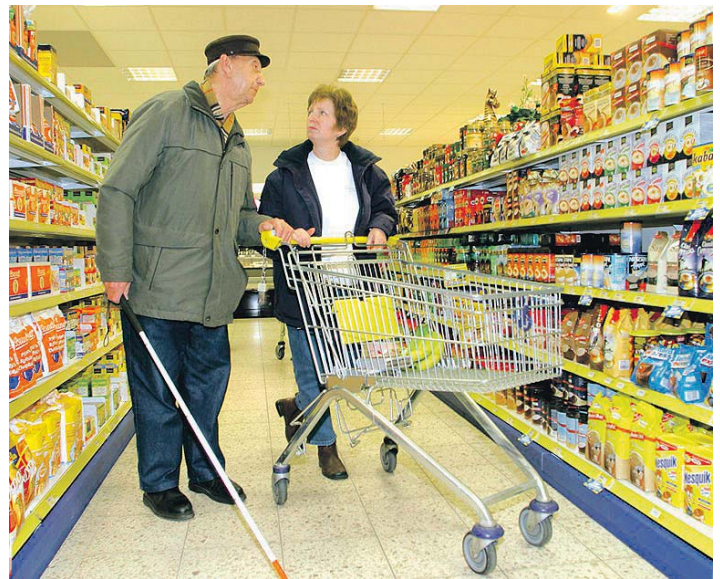
Unter seniorenfreundlichen Bedingungen älter werden.

Der Anteil der 60 bis 80-Jährigen an der Landkreisbevölkerung werde sich von 2008 bis 2032 um die Hälfte, nämlich von 19 auf 29,7 % erhöhen, der Anteil der über 80-Jährigen von 4,2 auf 8,5 % sogar verdoppeln.