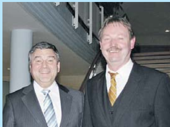
Gespräch im Landratsamt Miltenberg.

Miltenberg, um sich über aktuelle kommunalpolitische Themen zu informieren und sich mit seinem bayerischen Kollegen auszutauschen. Die beiden Landräte erinnerten daran, dass in diesem Jahr das 20-jährige Jubiläum der Deutschen Vereinigung gefeiert wird. Vor 20 Jahren habe auch der Landkreis Miltenberg damit begonnen, den damals noch selbstständigen Landkreis Ilmenau beim Aufbau seiner Verwaltung zu unterstützen. Zu Beginn der neunziger Jahre fand ein reger Informations- und Erfahrungsaustausch zwischen den beiden Kreisverwaltungen statt. Weitere Gespräche und Kontakte wurden beim jüngsten Besuch zwischen den Landräten vereinbart.