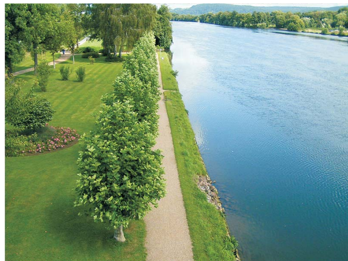
Blühende Landschaften am Bayerischen Untermain, diese könnte mit einer erfolgreichen Bewerbung für die Landesgartenschau 2016 Wirklichkeit werden.

Das vom Planungsbüro Böhringer aus Bad Alexandersbad entwickelte Konzept sieht eine Neubelebung der Flusslandschaft des Mains vor. Auf insgesamt gut 9,5 Hektar Fläche soll ein vernetzter Erlebnisraum entstehen, der das Freizeit- und Erholungsangebot auch über eine Landesgartenschau hinaus dauerhaft bereichert. Das Gesamtinvestitionsvolumen für notwendige Baumassnahmen wird mit 12,5 Millionen Euro veranschlagt, der Durchführungshaushalt wird mit ca. acht Millionen Euro kalkuliert. Für die Investitionen werden zahlreiche Fördergelder erwartet.