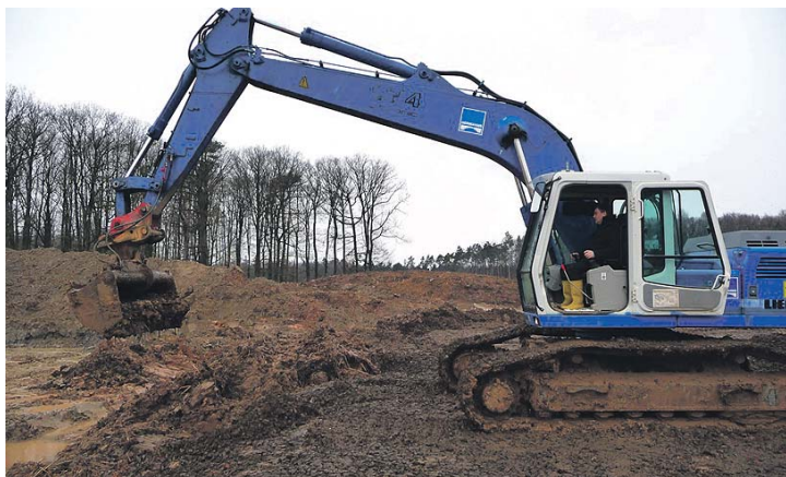
Landrat Roland Schwing beim „Spatenstich“ auf der Kreismülldeponie Guggenberg.

haltet den Neubau eines Deponieabschnittes für Abfälle der Deponieklasse II einschließlich der Errichtung einer gas- und wasserdichten Zwischenabdichtung zu den alten Deponieabschnitten. Hier können künftig bis zu 53000 Kubikmeter Abfall gelagert werden. Das heißt auf Basis der heute üblichen Abfallmengen, dass der Platz bis zu 21 Jahre lang ausreicht. Bei Bedarf, so Schwing, sei eine Erweiterung möglich. Das Ingenieurbüro IBU (Tauberbischofsheim), das umfangreiche Erfahrung im Deponiebau habe, hat den Bau geplant, sagte Schwing, für die Ausführung der Bauarbeiten ist die Arbeitsgemeinschaft Mülldeponie mit den Firmen Tesch (Schkeuditz) und Hermanns (Kassel) verantwortlich. Für das Büro IBU stellte Christoph Faulhaber die technischen Einzelheiten des ersten Bauabschnitts vor, für die beteiligten Firmen sprach Rolf Quickenstedt (Firma Tesch) von einer interessanten, aber auch schwierigen Aufgabe. Er sei zuversichtlich, dass die Deponiearbeiten wie gefordert am 15. Juli diesen Jahres beendet sind.